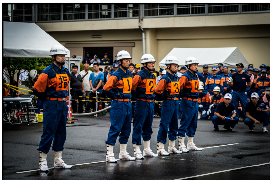
第29回埼玉県消防操法大会に出場した 熊谷市消防団第二中隊