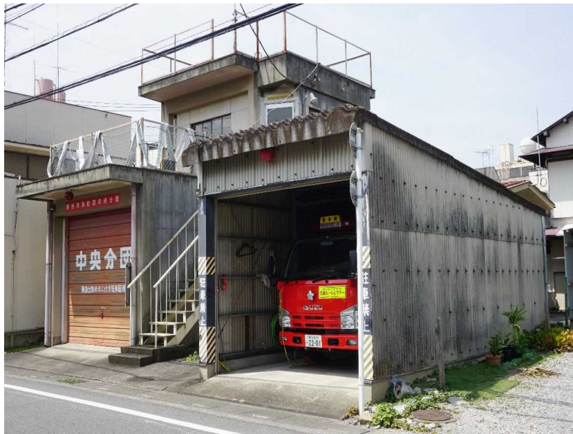
中央分団車庫及び団本部小隊車庫 (左)中央分団車庫 昭和42年建築 (右)団本部小隊車庫 昭和53年建築