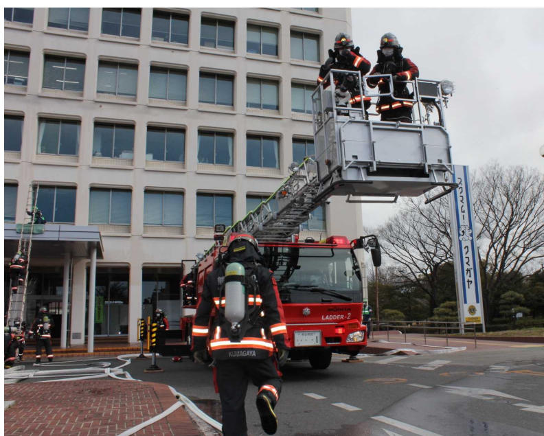
熊谷市役所において 令和4年春季消防総合演習