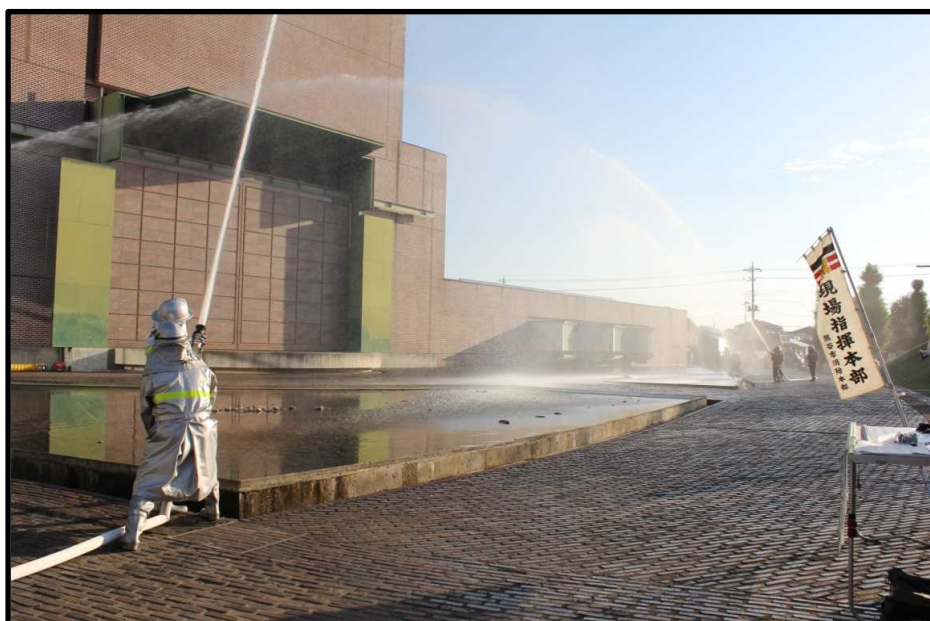
さくらめいとにおいて 平成30年秋季非常招集火災防御演習