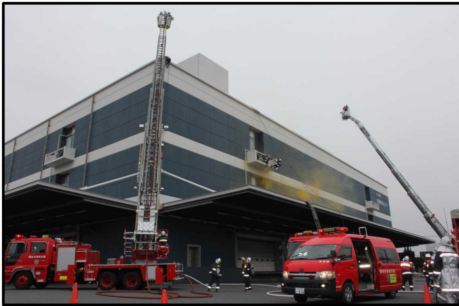
ソシオ熊谷流通センターにおいて 平成31年春季非常招集火災防御演習