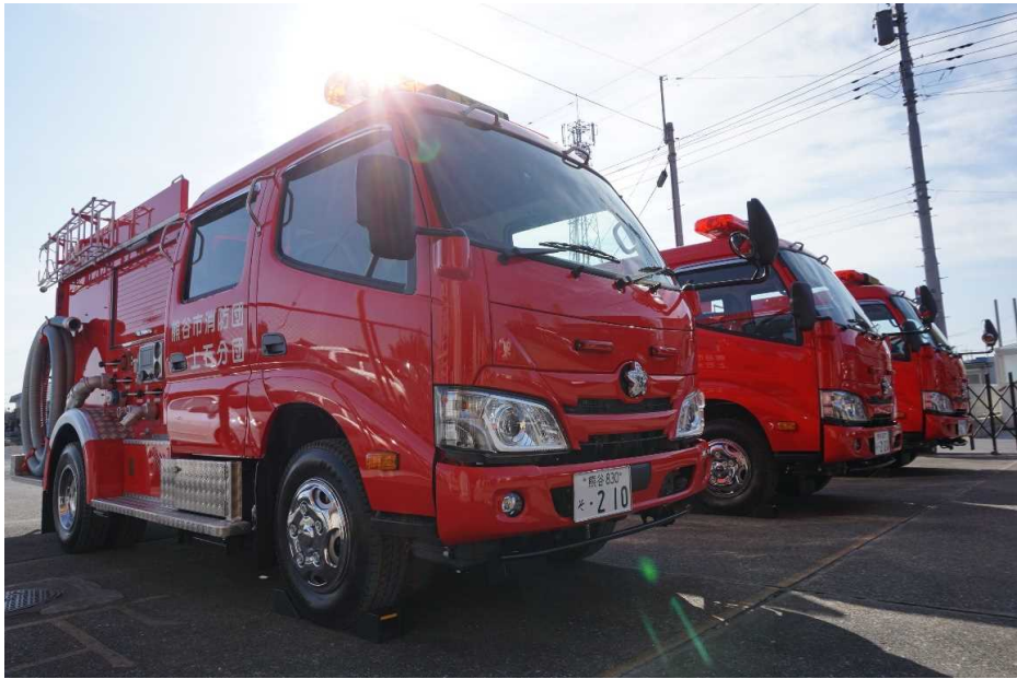
令和2年10月に更新した上石・妻沼・太田分団車