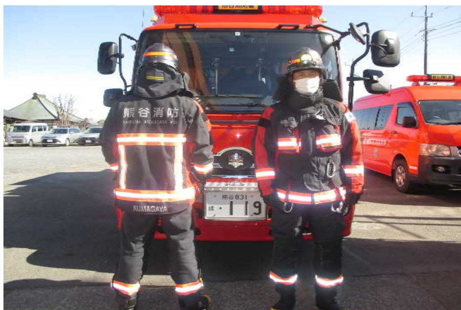
令和3年2月に更新した新型防火衣