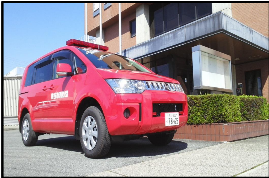
令和2年3月に更新した団本部女性小隊の広報車