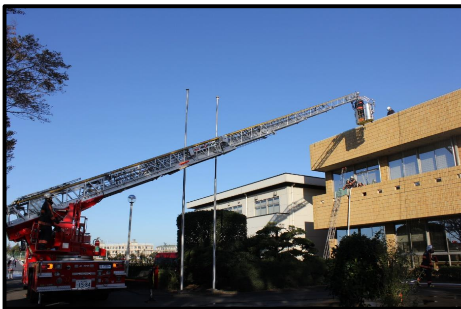
熊谷市大里庁舎において 令和元年秋季訓練非常招集及び火災防御演習