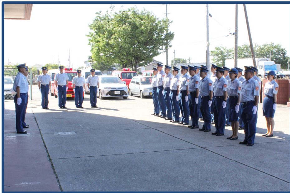
熊谷消防署通常点検