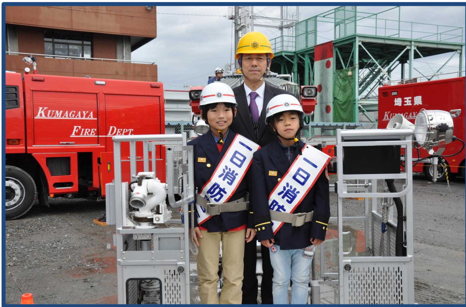
第16回消防フェアではしご車に搭乗する市長と一日消防署長